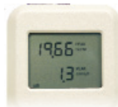
Muestra 2 parámetros del test